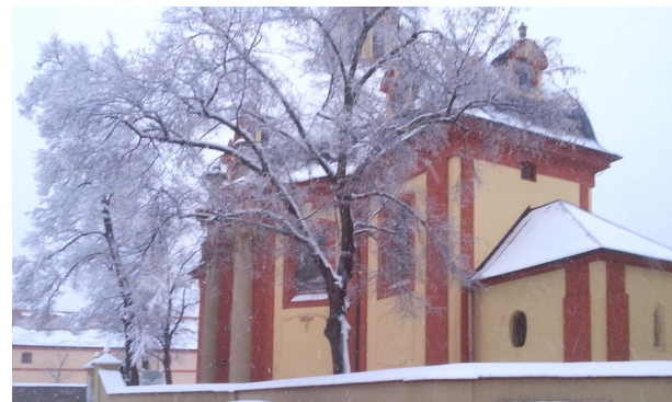
Kostel sv. Jakuba Staršího v Praze Kunraticích

Milí farníci a milá farní rodino, na prahu roku 2021 bych vám chtěla popřát pevné zdraví, hodně štěstí a hodně lásky. Lásku takovou, jako měl Pán Ježíš k nám lidem. Lásku shovívavou a milosrdnou. Na Nový rok jsme si dávali předsevzetí: budu se více modlit, budu víc číst Bibli, nebudu se dlouho dívat na televizi, budu se snažit pomáhat, zapojím se více do dění farnosti a jiné. Ale jak dlouho nám to vydrží? Týden? Měsíc? Jak by to asi dopadlo, kdyby takhle jednal Ježíš? Pán Ježíš přesto, že věděl, co ho čeká, neodmítl, neuhnul z cesty, kterou mu ustanovil Otec. Tak bychom měli jednat i my, nebo se o to alespoň snažit. Říká se, že ti, kdo hluboce věří, to mají jednodušší. Ale pro nás, kteří pochybujeme, naše vlastní předsevzetí nemají tu sílu a váhu, abychom se snažili je dodržet. Měli bychom si uvědomit, že na konci cesty není cesta, nýbrž cíl. Na konci zimy není zima, nýbrž jaro. Na konci noci není noc, ale svítání. Na konci smrti není smrt, ale ŽIVOT. Čeká nás slavnost Zjevení Páně. Radujme se z toho, že se nám Pán Ježíš zjevil jako Boží Syn, který otevřel svou náruč pro všechny, kteří hledají jeho vůli. Ještě jednou krásný a úspěšný nový rok vám ze srdce přeje